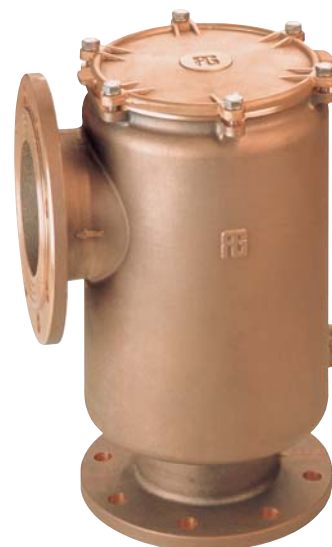
Tabella flange a pag. 182 Flange table on page 182